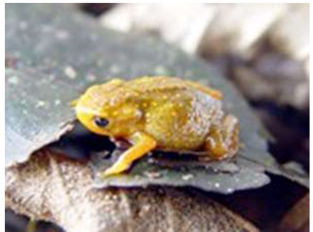
Figura 3. Espécime de Brachycephalus nodoterga na RTP. Figure 3. Specimen of Brachycephalus nodoterga at RBT.

Salesópolis (Pombal 2010), mas estas localidades estão isoladas devido ao desenvolvimento urbano. Brachycephalus nodoterga é um anfíbio anuro de pequeno porte, com até 1,5 cm de comprimento, presente na serrapilheira da mata (Pombal 2010). São animais diurnos e se movimentam lentamente entre a vegetação do chão da floresta. Esse registro sugere que a RBT pode abrigar outras espécies raras e sensíveis da Mata Atlântica.