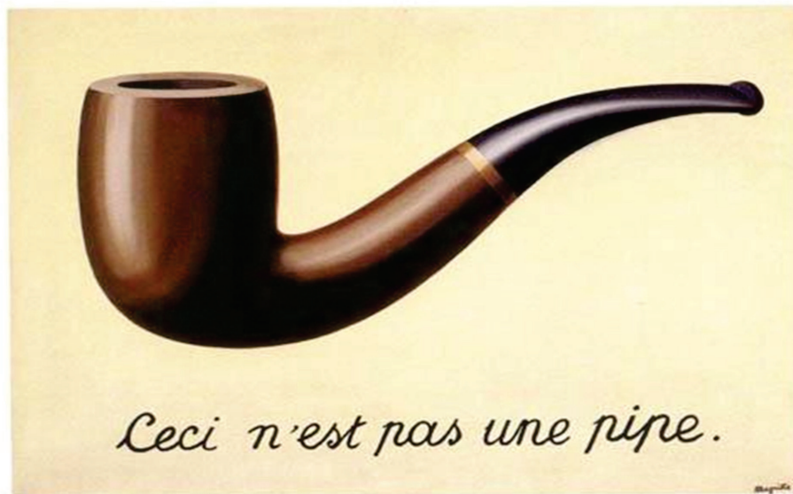
Figura 1. A Traição das Imagens (Isso não é um cachimbo) [La Trahison des Images (Ceci n'est pas une pipe)], de René Magritte.

Convidamos os leitores a analisar a Figura 1, esforçando-se para utilizar a perspectiva de observadores com experiências sensoriais diferentes das suas. Pressupomos que os analistas não têm problemas de visão, são adultos interessados por ciência, que viram pelo menos uma vez o objeto representado e que ainda não tenham analisado tal figura.