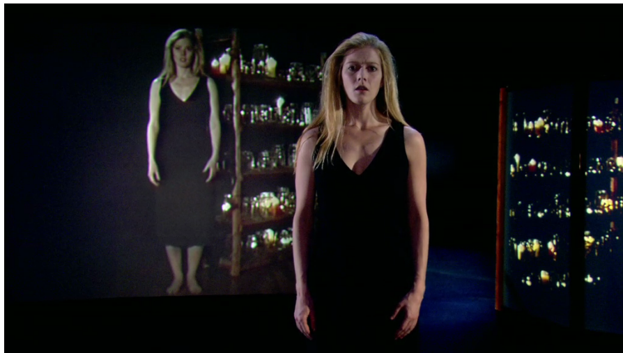
Figura 13. Fotograma da quarta seção.

Quinta seção. Após o “encontro” com seu alter ego idoso, começa uma seção que estaria dividida em duas partes. Na primeira, trabalha novamente sobre o poema III. Um “coro” harmonizado dobra a melodia com muito som de “ar”. Em alguns momentos, ela fala com seu alter ego, pedindo que ele vá embora. Esta seção começa suave e vai crescendo tanto em densidade quanto em ações e expressão. A melodia se torna mais extrema, aparecem contornos mais pontiagudos e o coro (já sem ar) mais complexo e claro. A soprano canta e se interrompe com pequenas frases faladas direcionadas ao seu alter ego idosa. Mudança abrupta de ação dramática. Ela corre pelo palco e, quando para, canta. Quer fugir. No momento em que ela se detém, a câmera se move em sua direção. Aproxima-se e afasta-se. Este tipo de ação é novo. Estamos chegando ao segundo ponto culminante da obra. Ela se desespera. No vídeo, aparece seu alter ego jovem e elas cantam em dueto com um pulso dado pelo som de um galho se quebrando.