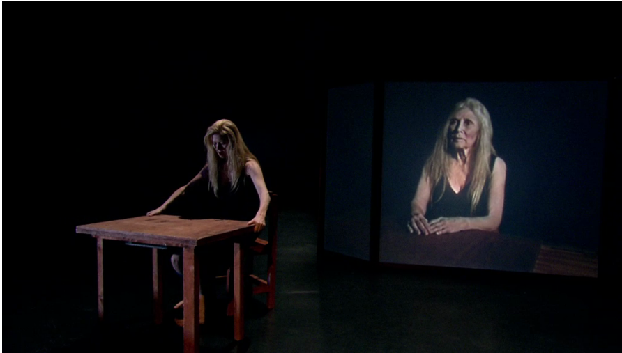
Figura 14. Fotograma da sexta seção.