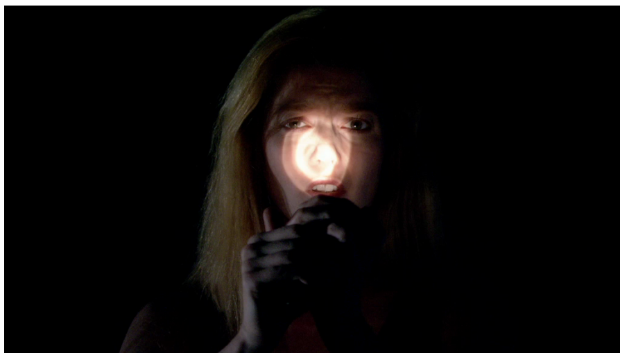
Figura 1. Fotograma da primeira seção.